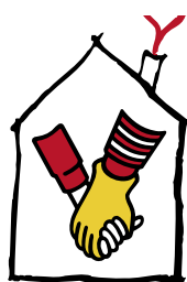
Ronald McDonald Lastentalosäätiö®

Potilashotellikerroksen huoneet ovat esteettömiä ja sisustukseltaan samanlaisia kuin muut Scandic Meilahti-hotellin huoneet. Lisätietoja potilashotellista löydät osoitteesta www.hus.fi/potilashotelli .